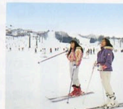
広大なパノラマゲレンデ