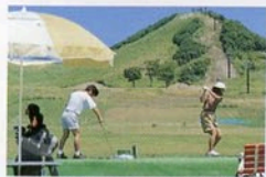
スポーツ・キャンプにとん平高原