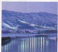
千曲川に映るナイターゲレンデ