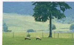
見晴らしが良い光ヶ原牧場