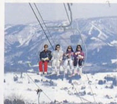
輸送力アップ/クワッドリフト