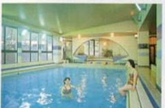
クアハウスを始め戸狩温泉、湯滝温泉などの共同浴場も/