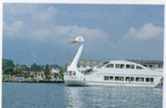
ちょっと足を延ばして野尻湖