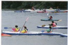
カヌーで千曲川下り